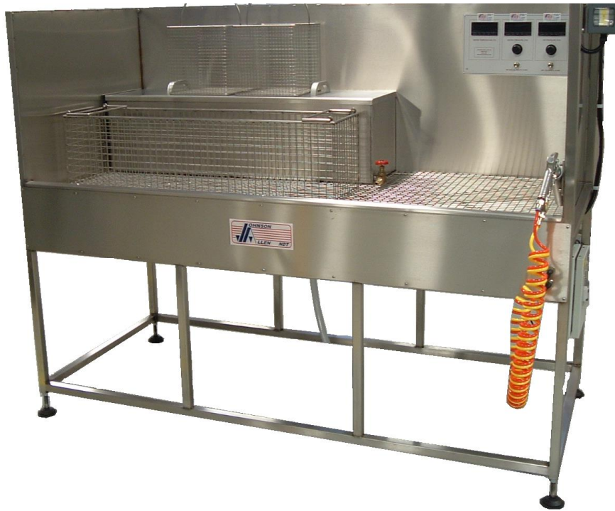
Formes, dimensions et fonctionnalités modulables